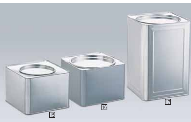
4ヶ 16 半缶(9ℓ) 6吋