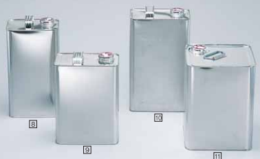
10ヶ 8 4ℓローヤル