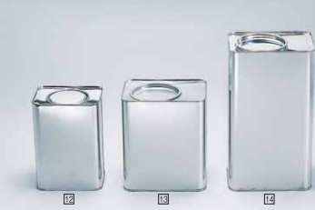
10ヶ 12 1K染料缶