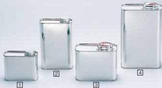
10ヶ 1 1/4ℓぬじ口