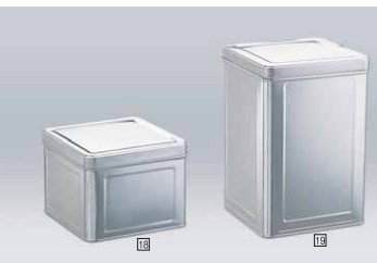
4ヶ 18 半缶9ℓ天切